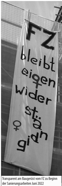
Transparent am Baugerüst vom FZ zu Beginn der Sanierungsarbeiten Juni 2022

Im Mietvertrag zwischen WUK und Stadt Wien wird tatsächlich angegeben, dass das WUK 1981 das gesamte Gebäude Währinger Straße 59 übernommen hätte und das WUK das gesamte Gebäude seit 1981 nutzt?! Dies entspricht nicht den Tatsachen! Das FZ war nie Teil des WUK und das WUK war daher nie im Besitz des gesamten Gebäudes. Das ist