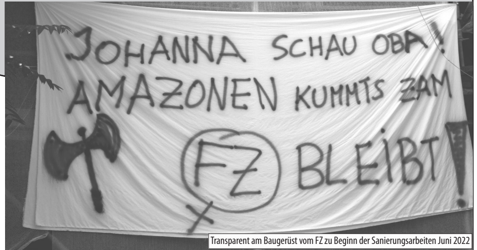
Transparent am Baugerüst vom FZ zu Beginn der Sanierungsarbeiten Juni 2022

Zur Geschichte: 1981 wurde das damals leerstehende Gebäude TGM (Technisches Gewerbemuseum), das dem Bund gehörte und abgerissen werden sollte, vom Verein FZ und dem Verein WUK (Werkstätten und Kulturhaus) „In-Bestand-genommen“. Es waren die Frauen, die den Schlüssel „organisierten“ und als erstes in das Gebäude gingen. Seither wird der Gebäudekomplex Währingerstraße 59 in Wien vom FZ (Stiege 6) und vom WUK (Stiege 1-5) genutzt. Über all die Jahre gab es zwischen FZ und WUK solidarischen Austausch und Absprachen über eine nachbarschaftliche Nutzung des Gebäudes. Aber es gab auch immer wieder kontroverse Einschätzungen und Konflikte mit dem WUK-Vorstand über notwendige Sanierungsarbeiten, die ungleich verteilt